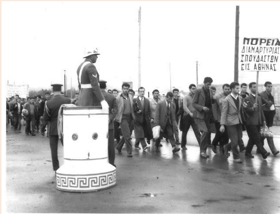
Η ΜΕΓΑΛΥΤΕΡΗ ΠΟΡΕΙΑ ΤΟΥ ΑΙΩΝΑ (ΘΕΣΣΑΛΟΝΙΚΗ – ΑΘΗΝΑ) 1960