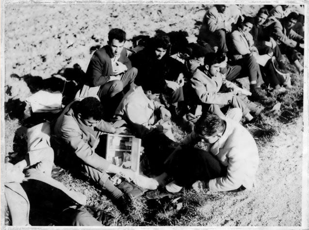
Λίγη περιποίηση των ποδιών, με το φορητό φαρμακείο, και ξανά πορεία...