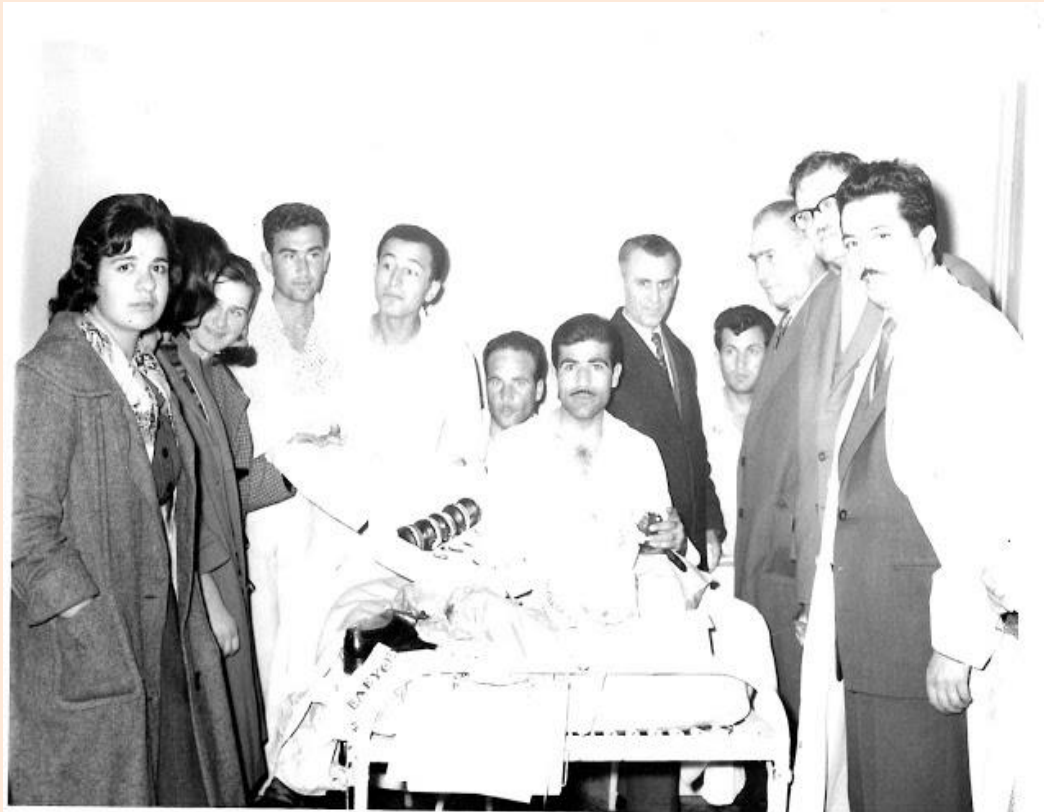
Αγωνιστής Σπουδαστής νοσηλεύομενος στο κρεβάτι του νοσοκομείου