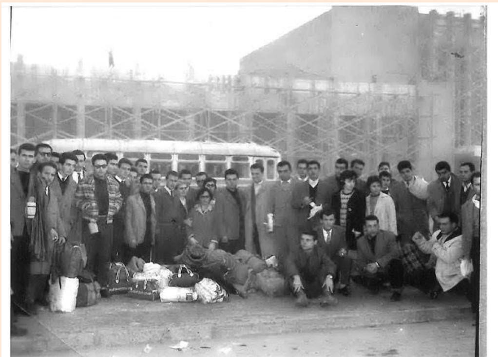
16-12-1960 ΣΙΔ. ΣΤΑΘΜΟΣ ΘΕΣΣΑΛΟΝΙΚΗΣ. Σημείο συγκέντρωσης των Σπουδαστών για το ξεκίνημα της πορείας του αιώνα!!!

Η μεγαλύτερη πορεία, που έγινε ποτέ στην Ελλάδα, ήταν η πολυήμερη πορεία των 70 Σπουδαστών της Σχολής Υπομηχανικών Θεσσαλονίκης. Οι Σπουδαστές ξεκίνησαν, στις 16/12/1960 χωρίς τη χρησιμοποίηση ουδενός συγκοινωνιακού μέσου, από τη Θεσσαλονίκη μέχρι την Αθήνα, πεζή από την αρχή μέχρι το τέλος της διαδρομής. Η πορεία πραγματοποιήθηκε σε ένδειξη διαμαρτυρίας για τη μη κατάταξη των Σχολών στην ανωτέρα βαθμίδα.